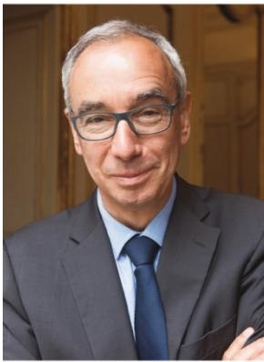
Jean Pisani-Ferry Commissaire général de France Stratégie

À la suite de l'adoption du plan pluriannuel de lutte contre la pauvreté et pour l'inclusion sociale, le Premier ministre a demandé à France Stratégie de constituer une commission chargée d'élaborer une stratégie nationale pour l'enfance et l'adolescence.